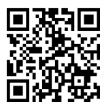
りゅうしょうどう接骨院さんのHP